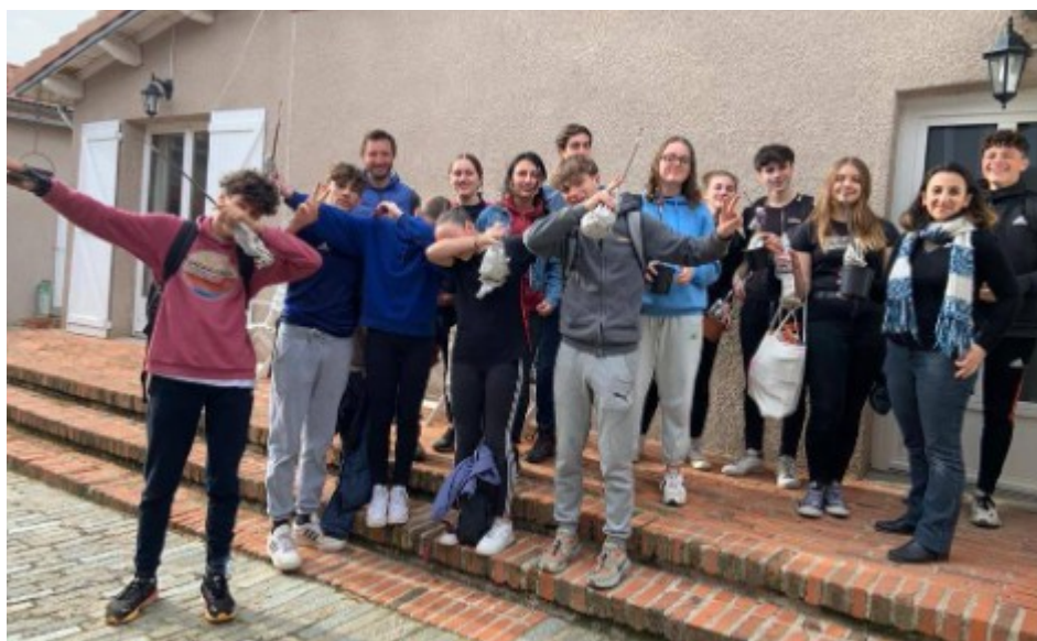
Formation à l'agriculture biologique avec les lycéens du Forez