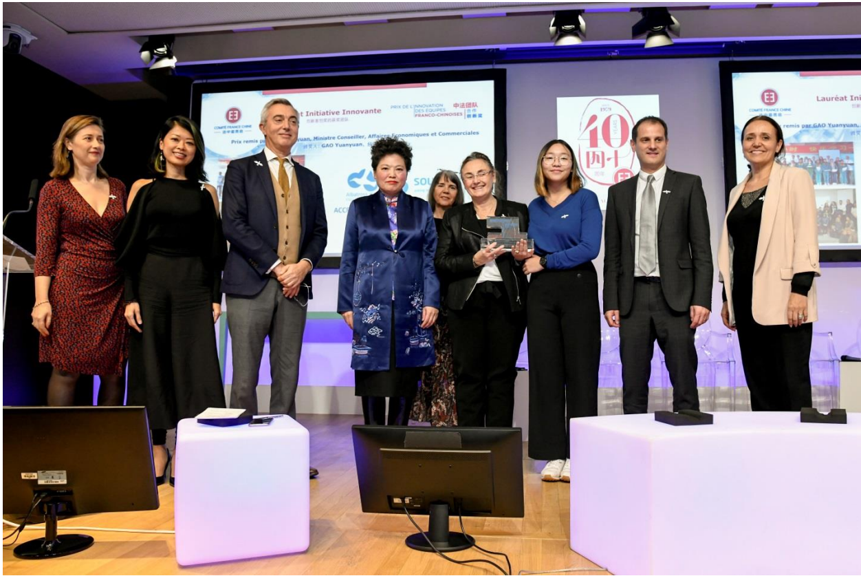
Cérémonie du comité France-Chine du MEDEF le 19 décembre 2019 à Paris. L'équipe Albatross reçoit le prix de l'innovation. Projets GAIA et SAPHIR