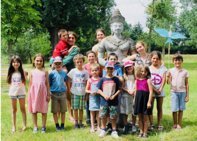
Classe verte des enfants de l'Ecole Arc en ciel – Albatross (Violay, Loire, France), Juin 2018

Albatross » qui réduisent les couts de scolarité. L'école est située en milieu rural près du siège de Albatross Foundation qui se situe dans le village médiéval de Pouilly-les-Feurs (Loire).