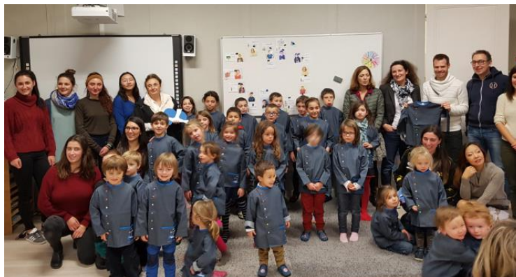
Donation de livres et programme de formation, Ecole Arc-en-ciel Albatross (F)