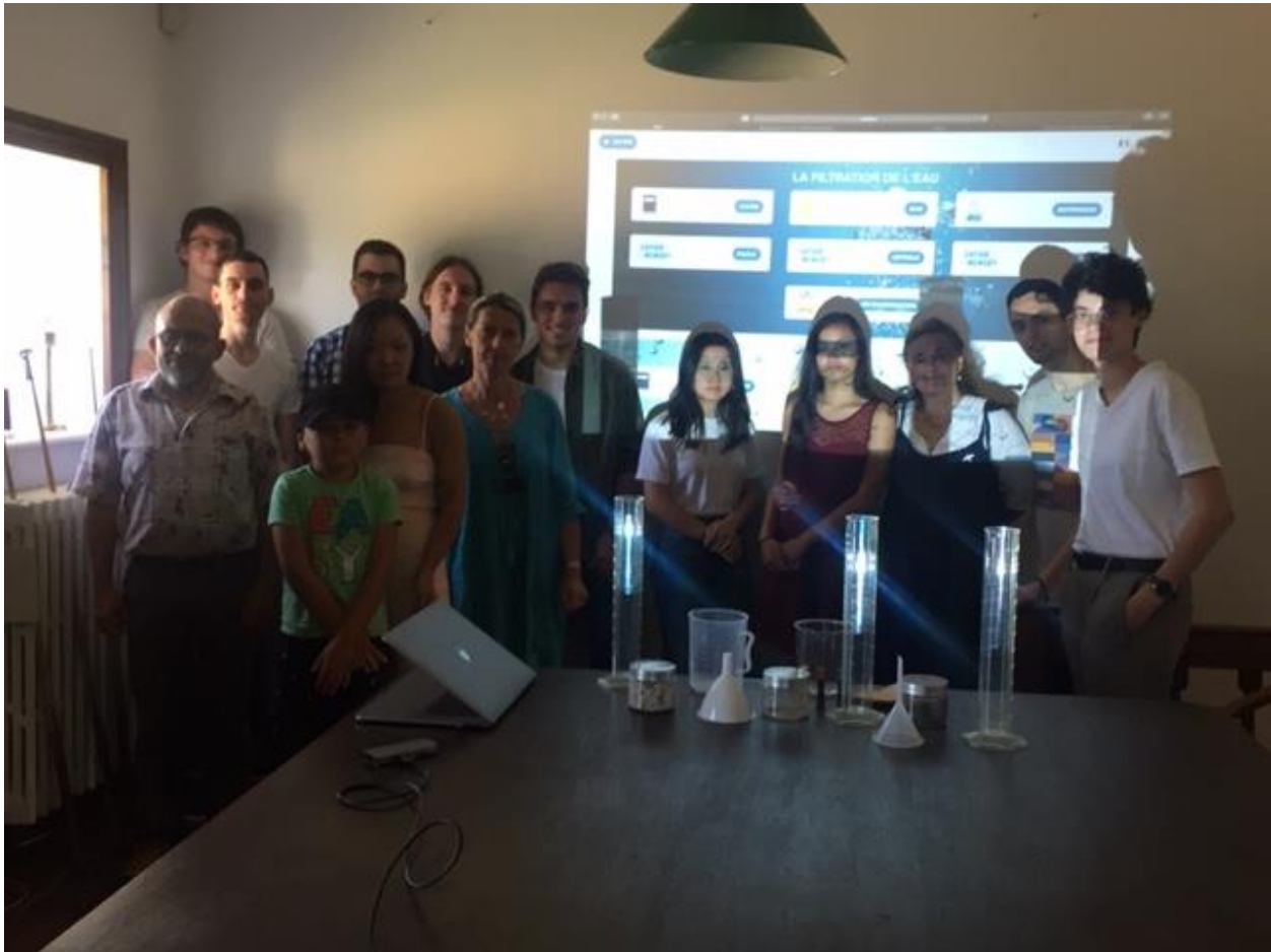
Formation de formateurs sur les applications mobiles SAPHIR par les étudiants de l'association partenaire www.Lacruz.org