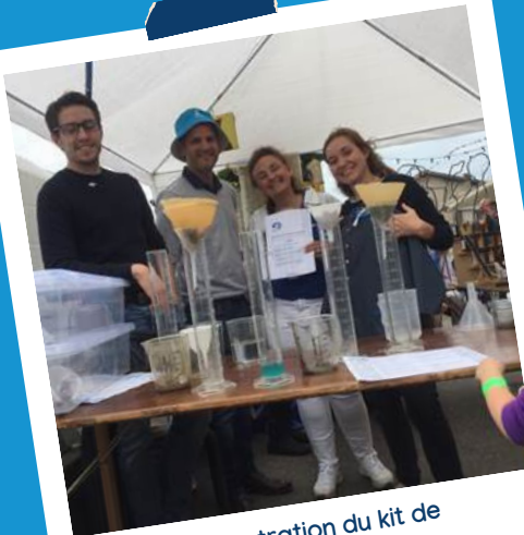
Démonstration du kit de purification d'eau à l'école Albatross – Arc-En-Ciel (Violay/Loire)

livres Albatross distribués gratuitement