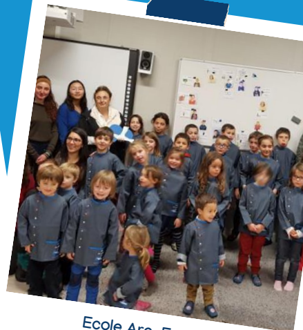
Ecole Arc-En-Ciel, participative et solidaire multilingue (français, anglais et chinois)