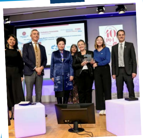
Albatross a reçu le prix de l'innovation du Comité France-Chine du MEDEF (Jury CNRS) pour son projet de purification d'eau